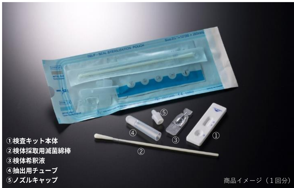
商品イメージ（1回分）