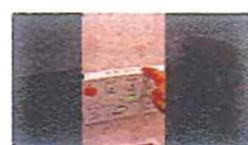
洗浄パネル 約200cm 2