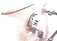
シフトレバー 約150cm 2