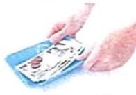
釣銭トレイ 全面約350cm 2