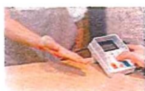
カード決済端末機 約300cm 2