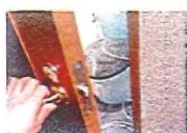
トイレのドアノブ 約100cm 2