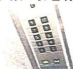
エレベーターボタン 約450cm 2